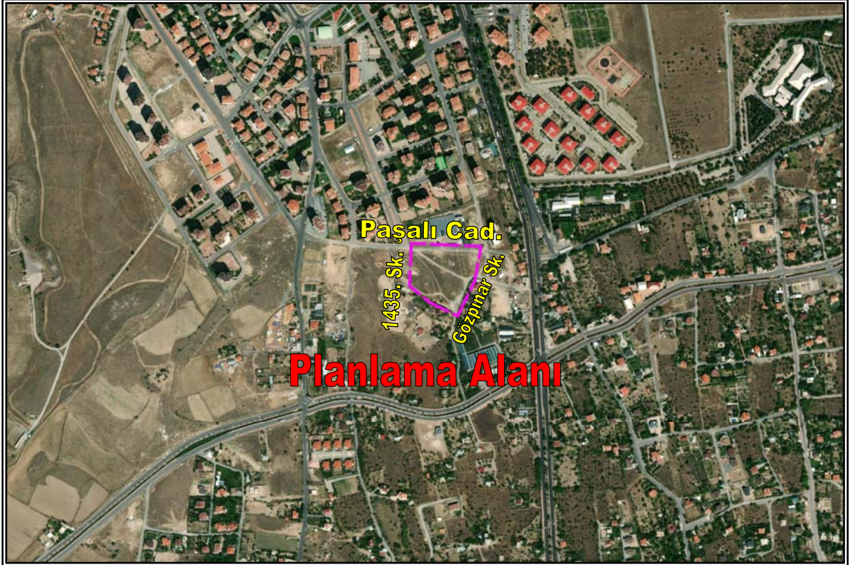
Resim 1: Planlama Alanının Konumu

Planlama alanı; düz bir arazi yapısına sahiptir. Bahse konu alan üzerinde herhangi bir yapılaşma görülmemiş olup boş arazi statüsündedir. Planlama alanının yakın çevresinde ise 1-2 katlı, konut kullanımlı yapılar ve boş araziler yer almaktadır.