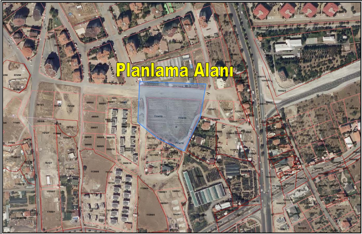
Resim 3: Planlama Alanı Mülkiyet Durumu

Planlama alanı; tapuda Melikgazi İlçesi, 1. Eskişehir Mahallesi sınırları içerisinde, mülkiyeti Küçük Söğütlü Önü Vakfına ait 7114 ada 10 parsel numaralı taşınmazın bulunduğu alanda yer almaktadır. (Bkz. Resim 3)